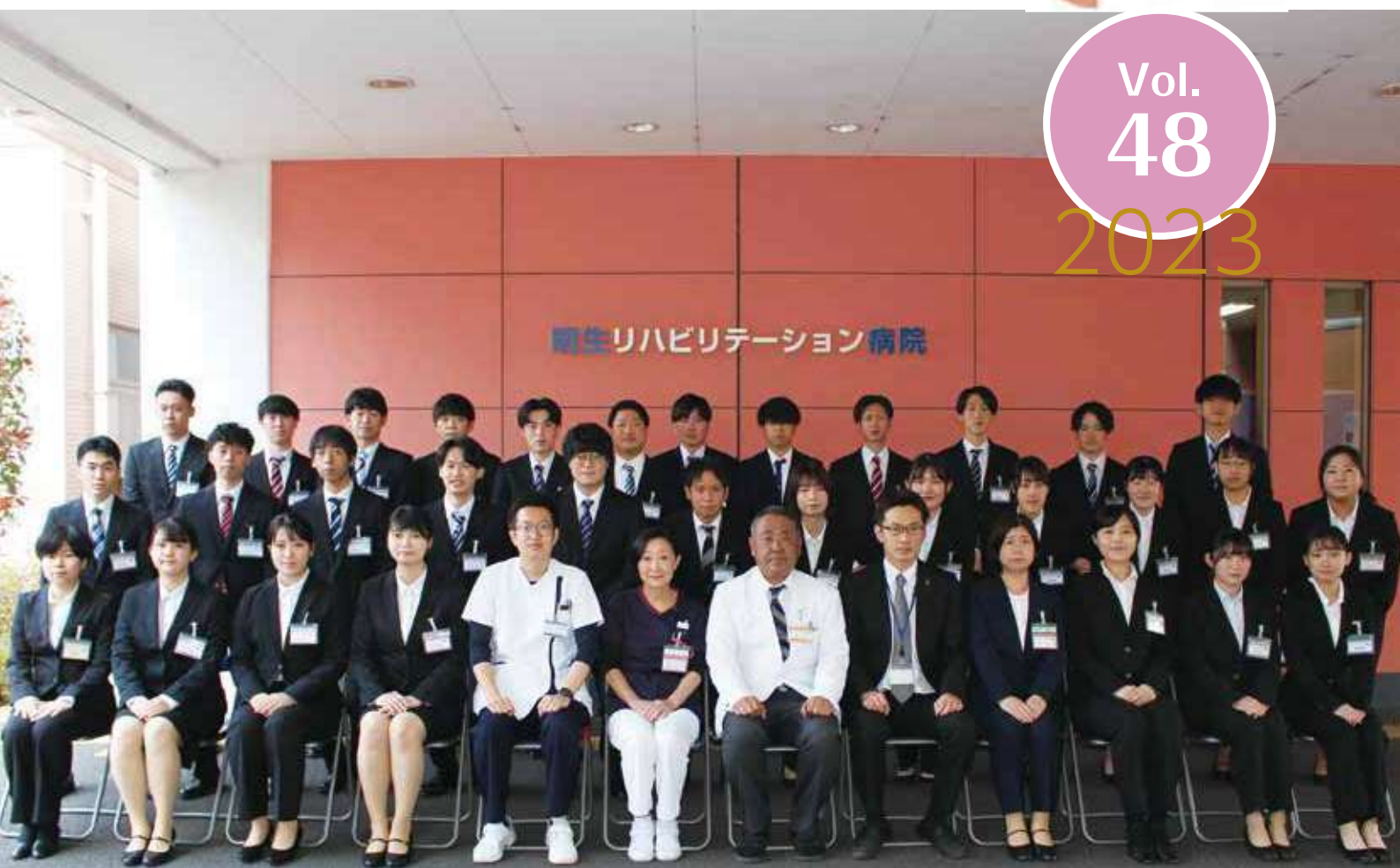
令和5年新入職員 集合写真