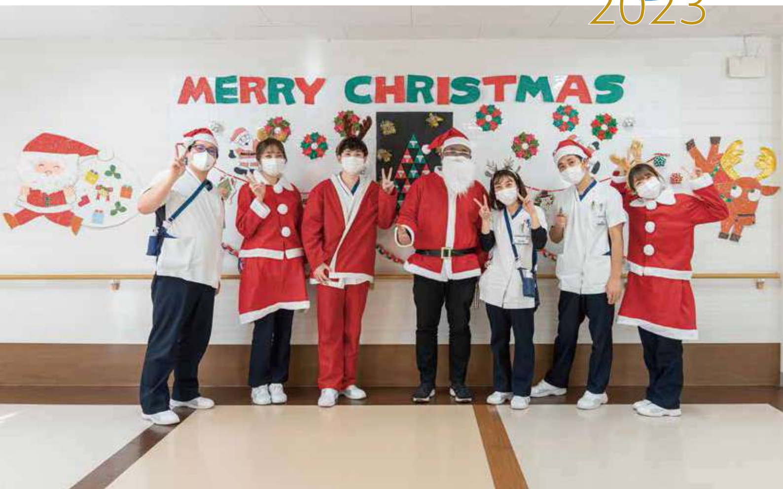
撮影場所：クリスマス会