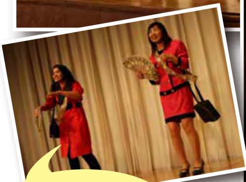
お笑い芸人の平野ノラさんをモチーフにした衣装でダンスを披露